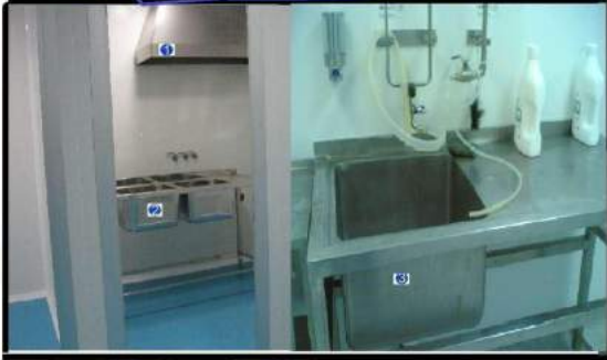
تجهیزات مخصوص آزمایشگاه تمیز - سیستم استیل در رنگه - سیستم استیل تک لکه