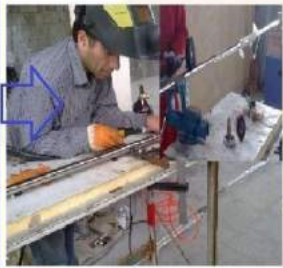
فیل‌های اتماتیک اینترلاک و سیستم‌های کنترلی مرتبط مخصوص اتاقهای تمیز