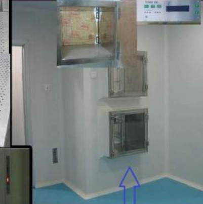
چسب باکس درپوش در اینترلاک - اتماتیک - داخل استیل و تماماً استیل یا آهن و بدون فلز اینترلاک - فیلتر سلفون در اندازه‌های مختلف