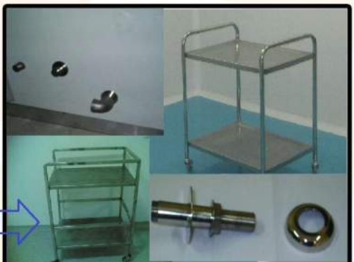
تورهای های استیل در اندازه‌ها و طبقه‌های مختلف و تجهیزات استیل مخصوص نصب روی لوله‌ها در فضاهای استریل و اینترلاک مخصوص صنایع دارویی، پزشکی، بیوسنسای و آرایشی بهداشتی